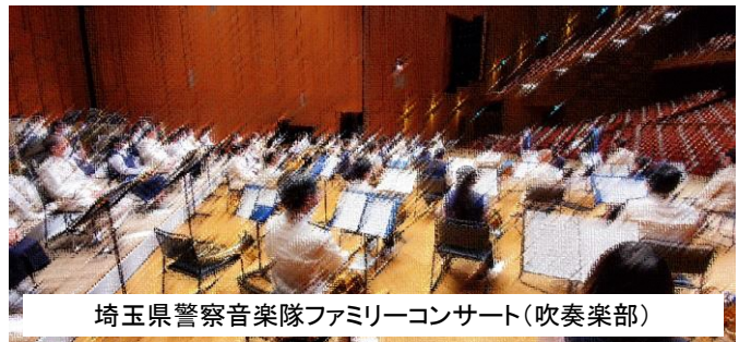
埼玉県警察音楽隊ファミリーコンサート(吹奏楽部)