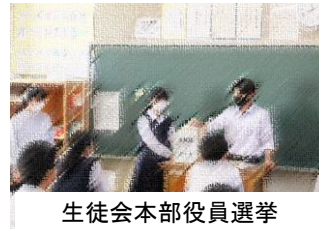
生徒会本部役員選挙