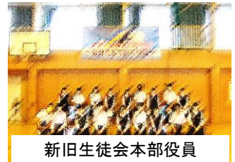
新舊生徒会本部役員