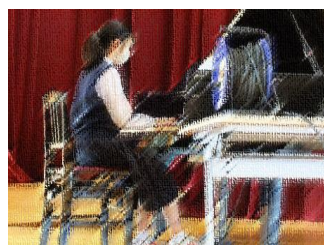
2学期始業式(オンライン) 校歌(心の中で斉唱)

○新型コロナウイルス感染症拡大予防について これまでと同様、お子さんまたは同居のご家族に風邪症状があるときは出席停止となりますので、学校へ連絡の上、登校させないようお願いいたします。新型コロナウイルスのワクチン接種、及び副反応による体調不良も出席停止となります。また、万が一、本人および同居のご家族の方が罹患、または濃厚接触者、PCR検査等の対象となった場合は保健所の指導に従っていただくとともに学校にも連絡をお願いいたします。 休日・夜間の場合は川越市役所代表電話(224-8811)に連絡をお願いします。保護者の皆さまも健康に留意し、引き続き感染予防に努めていただきますようお願いいたします。