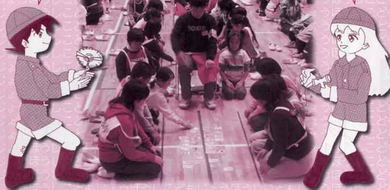
第3回川越市子どもカルタ大会 (川越市子ども会育成団体連絡協議会主催)