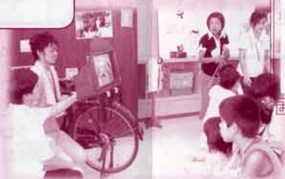
はくぶつかん とうたいけんきょうしつ 博物館の土曜体験教室「紙しばい」