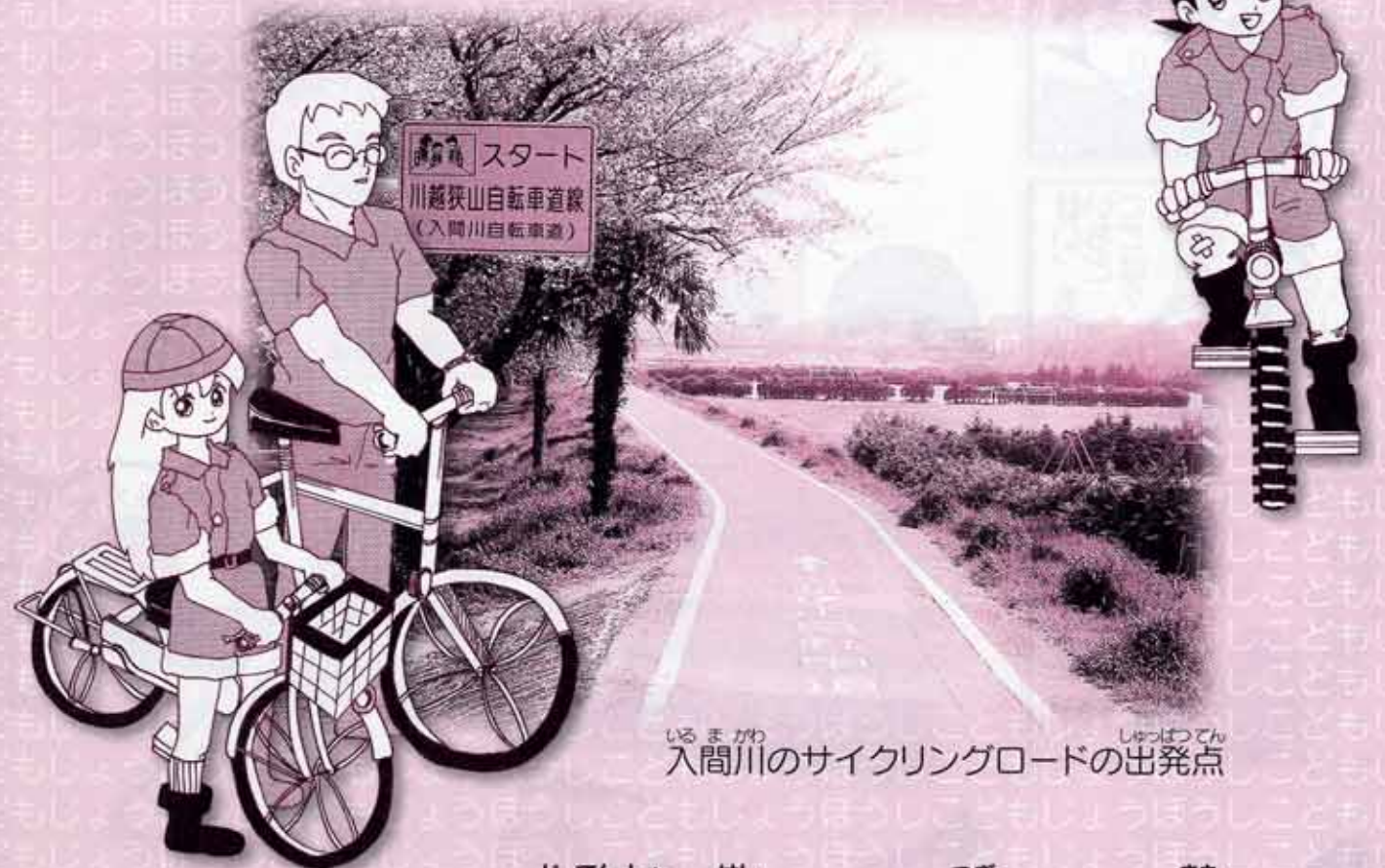
入間川のサイクリングロードの出発点