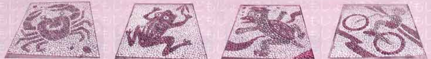
安比奈親水公園内にあるモザイク画の石畳(このほかにもたくさんあるよ!)