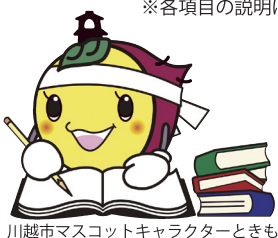
川越市マスコットキャラクターととも

発行 川越市・川越市教育委員会 編集 川越市教育委員会教育総務課教育総務課 〒350-8601 埼玉県川越市元町 1 丁目 3 番地 1 電話 049-224-6074 (直通) http://www.city.kawagoe.saitama.jp/