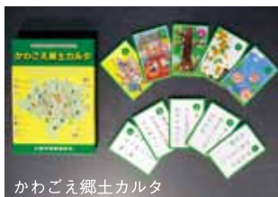
かわごえ郷土カルタ