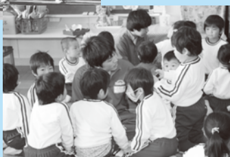
みよしの幼稚園での活動風景