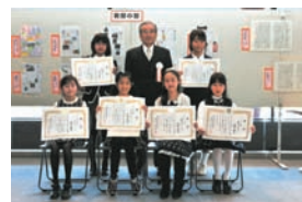
昨年度のベスト見つけ賞受賞者