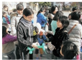
ジュニアリーダーも大活躍!

受付に並ぶ長い列、開会式前から、たくさんの子もたちが集った校庭。サポート委員さんが準備したあめつつかみどりコーナーは子どもたちに大変人気でした。