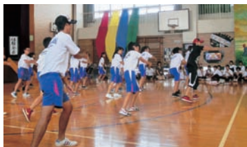
振り付けを覚えてダンス!ダンス!

もう一つの新講座は、講師の動きをまねて、「ヒップホップダンス」体験。二十数名でリズムに合わせて踊ると、教室の中は、まるでダンススタジオのようになりました。体育館での発表では、会場の生徒から熱い声援が送られました。