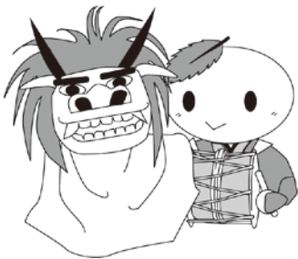
かわねえやがあと 河越館イメージキャラクター 河越茶太郎

獅子座という星座があります。この「獅子」とはライオンのこと。では、「獅子舞」はライオンが踊ることなのでしょうか？