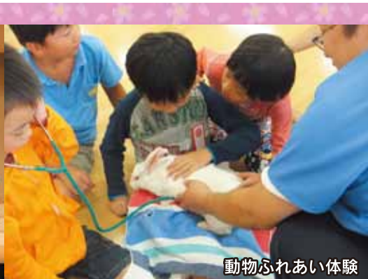
動物ふれあい体験