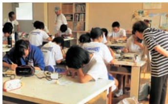
焼きコテで好きな絵を描きます