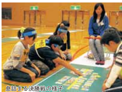
息詰まる決勝戦の様子