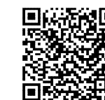
川越市ホームページ (病児保育事業)

〒350-8601 川越市元町1-3-1 川越市 こども未来部 こども育成課 電話 049-224-5724 FAX 049-224-6705