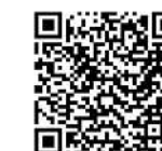
川越市ホームページ (病児保育事業)

〒350-8601 川越市元町1-3-1 川越市 こども未来部 こども育成課 電話 049-224-5724 FAX 049-224-6705