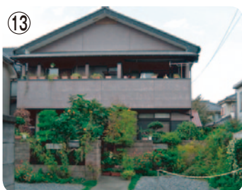
⑬ ながの生活骨董館