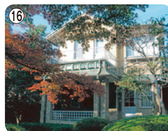
⑯ 旧山崎家別邸 (庭園)