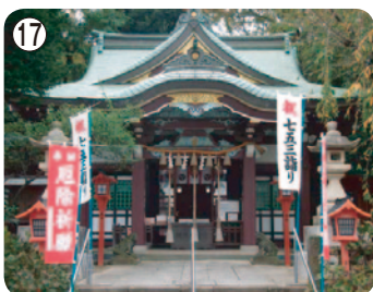
⑰ 川越八幡宮 (文学館)