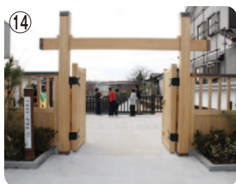
⑭ 川越城中ノ門堀跡