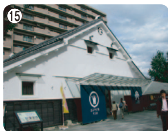
⑮ 小江戸蔵里 (産業観光館)