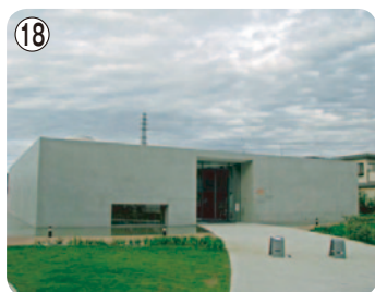
⑱ ヤオコー川越美術館