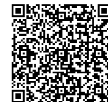
川越市HP 子宮がん検診について

4月1日時点で20歳の方には、子宮頸がん検診を無料で受診できる「子宮頸がん検診無料クーポン」をお送りします。(5月末に発送)