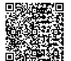
お申し込みはこちら

詳しくは、川越市のホームページ、または「健康づくりスケジュール」(3月下旬に全戸配布)をご覧ください。