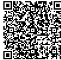
厚生労働省HP HPVリーフレット等