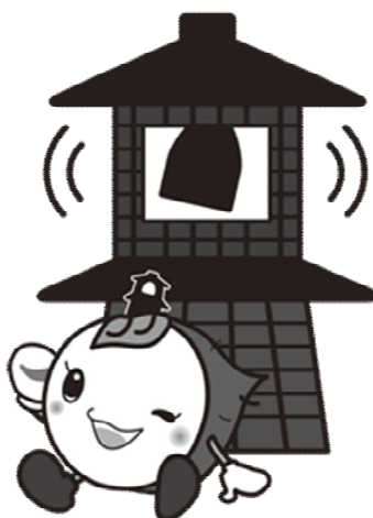
川越市マスコットキャラクター ときも

漬物に係る衛生上の危害の発生を防止するため、その原材料の受入れから製品の販売までの各工程における取扱い等の指針を示したものであり、漬物に関する衛生の確保及び向上を図ることを目的としています。平成24年に発生した浅漬による腸管出血性大腸菌食中毒の発生を受け、平成25年12月13日に改正されました。