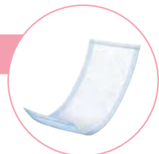
(写真はフラットタイプ)

さまざまな症状、体格などに応じて使用できる便利で 経済的なタイプです。おむつカバー併用。