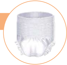
(イラストはパンツタイプ)