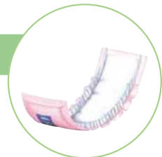
(イラストはパッドタイプ)

排尿後、尿のキレが悪かったり、咳き込んだり笑ったり したときにわずかにモれる方に気軽にご使用いただけ るタイプです。他の紙おむつと組み合わせて使用する と非常に経済的です。