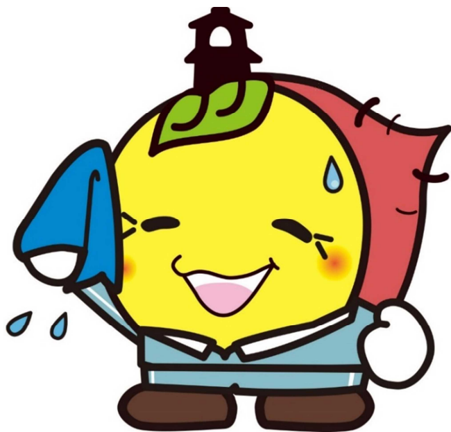
川越市マスコットキャラクター