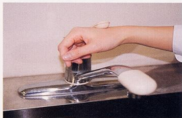
7. 水道の栓を止めるときは、手首か肘で止める。できないときは、ペーパータオルを使用して止める