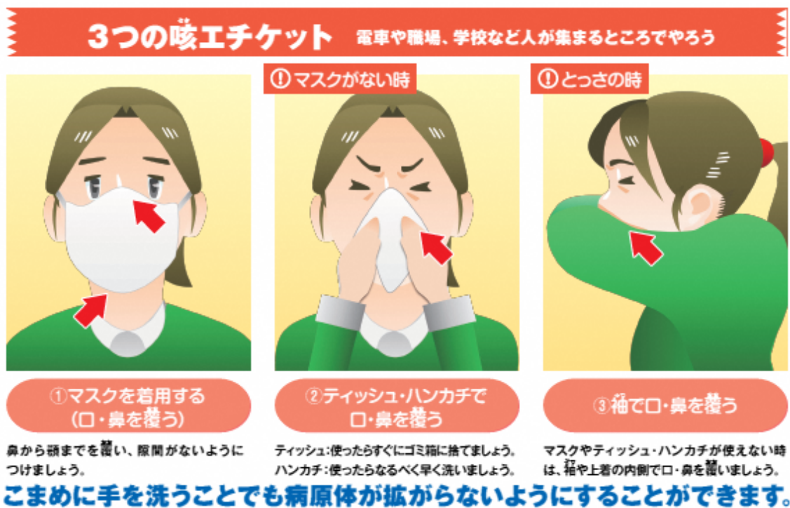
図3 咳エチケットについて