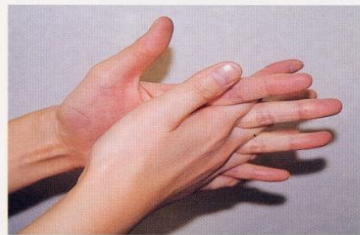
4. 指の間を十分に洗う