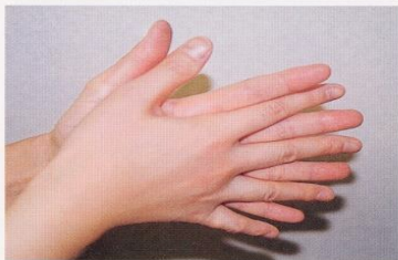
1. 手のひらを合わせ、よく洗う