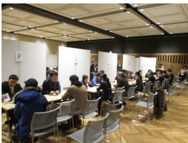
市内農業者と飲食店経営者などがマッチングを行う異業種交流会