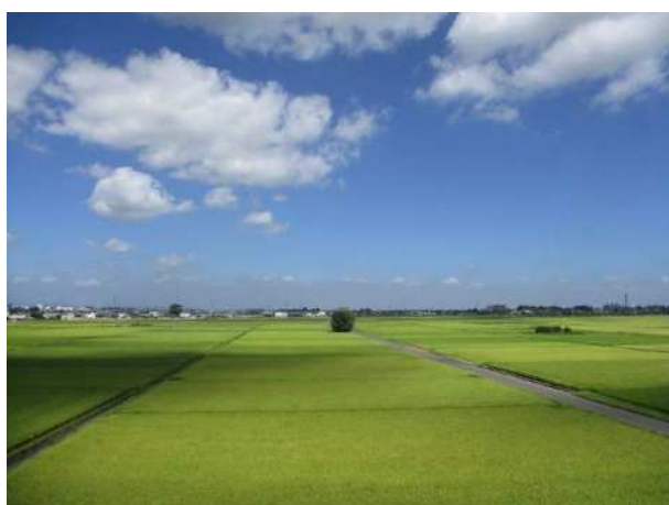
農業振興地域を中心に広がる市内の水田