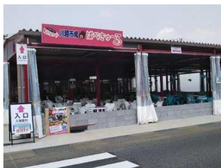
令和元年8月に市場内にオープンしたバーベキュー施設