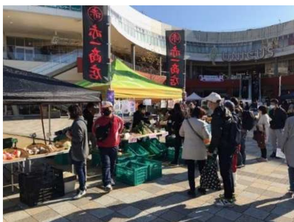
川越産農産物の消費拡大、知名度向上に向け、市内農業者が出店する直売イベント