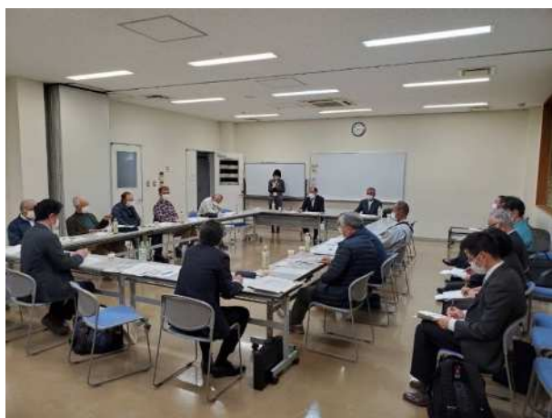
人・農地プランの推進及び実行のための会議