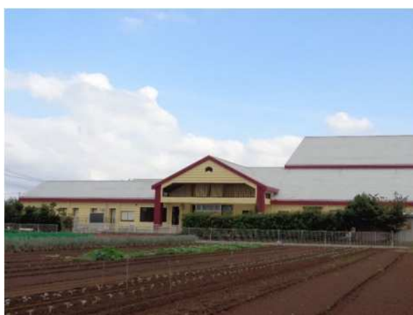
グリーンツーリズム拠点施設の体験農園ではさまざまな農業体験を実施している