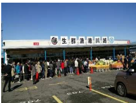
平成31年4月に市場内にオープンした小売施設