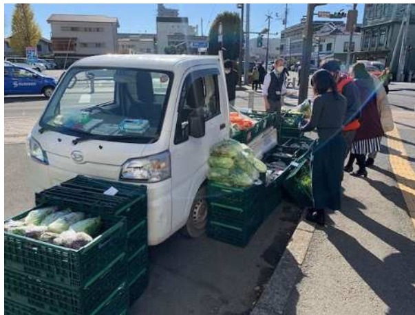
新規就農者への販売支援として市役所前で直売イベントを実施