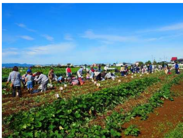
参加希望者が多い芋ほり体験