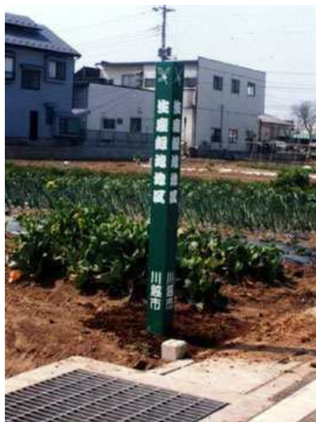
市内に点在する生産緑地地区

生産緑地地区については、その多くが令和4年（2022年）に指定後30年を迎え、市町村への買取申出ができるようになったことから、農地の減少が懸念されています。