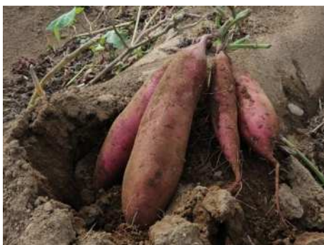
消費者に特に「川越産」を選びたい品目として選ばれたさつまいも