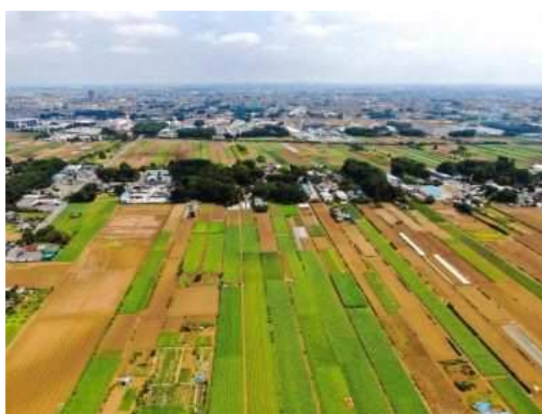
市内有数の畑作地域である福原地域の農地

※市街化区域…既に市街地を形成している区域と概ね 10 年以内に優先的かつ計画的に市街化を図る区域であり、都市の発展動向等を勘案して市街地として積極的に整備する区域。