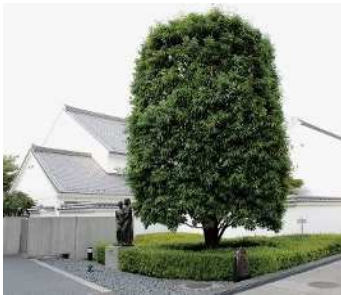
市の木 かし (昭和 57 年制定)