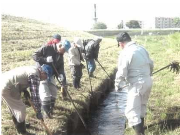
多面的機能支払交付金を活用した水路の泥上げ