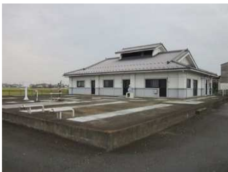
平成 18 年度に供用を開始した鴨田農業集落排水処理施設