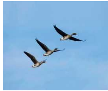
市の鳥 雁 (かり) (平成 4 年制定)