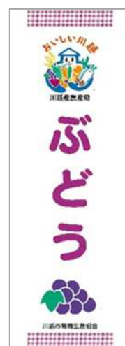
川越産のぶどうをPRするのぼり