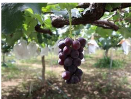
川越の巨峰はほぼ直売で売り切れる

※その他の回答には、直接購入しない理由として、「近くにない」、「無人だと不安がある」、「スーパーマーケットに地場農産物コーナーがある」などがありました。