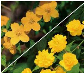
市の花 山吹 (やまぶき) (昭和 57 年制定)