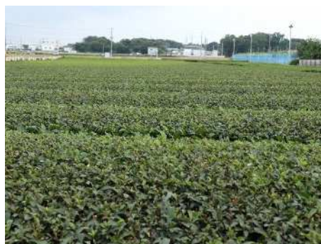
川越は鎌倉時代から「武蔵河越」として知られる茶の産地