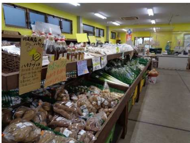
市内の農産物直売所の売り場

本市農業者の出荷先は「農協」が一番多く、次いで「消費者に直接販売」、「小売業者」となっています。また、近年伸び悩んでいた市内の農産物直売所3カ所の合計販売額は、令和2年度に増加しています。