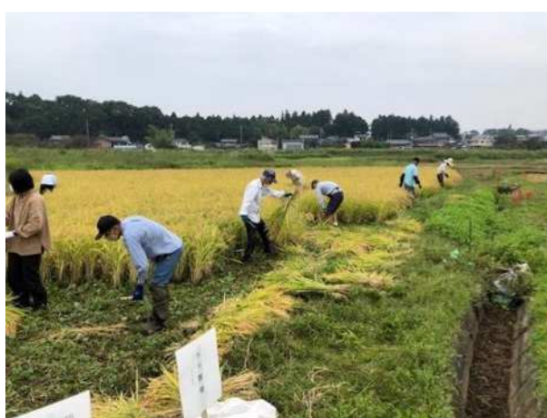
参加者を募り霞ヶ関地区内の遊休農地を活用した米作りを行う団体の活動

※その他の回答には、「興味はあるが、体力的に無理」、「趣味としてなら」、「子どもが小さいので時間がとれない(小学生くらいになったら体験させたい)」などがあつた。