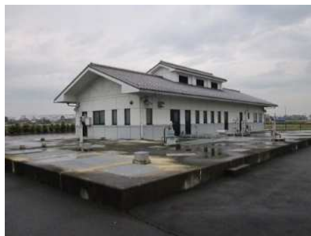
平成 24 年度に供用を開始した石田本郷農業集落排水処理施設