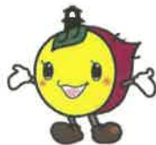
川越市マスコットときも