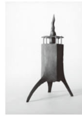
鈴木英明 《最初の空地》 2006年

◆タッチアートコーナー ID1020699 「コレクション さわって ひろげて」 日6月21日(日)まで