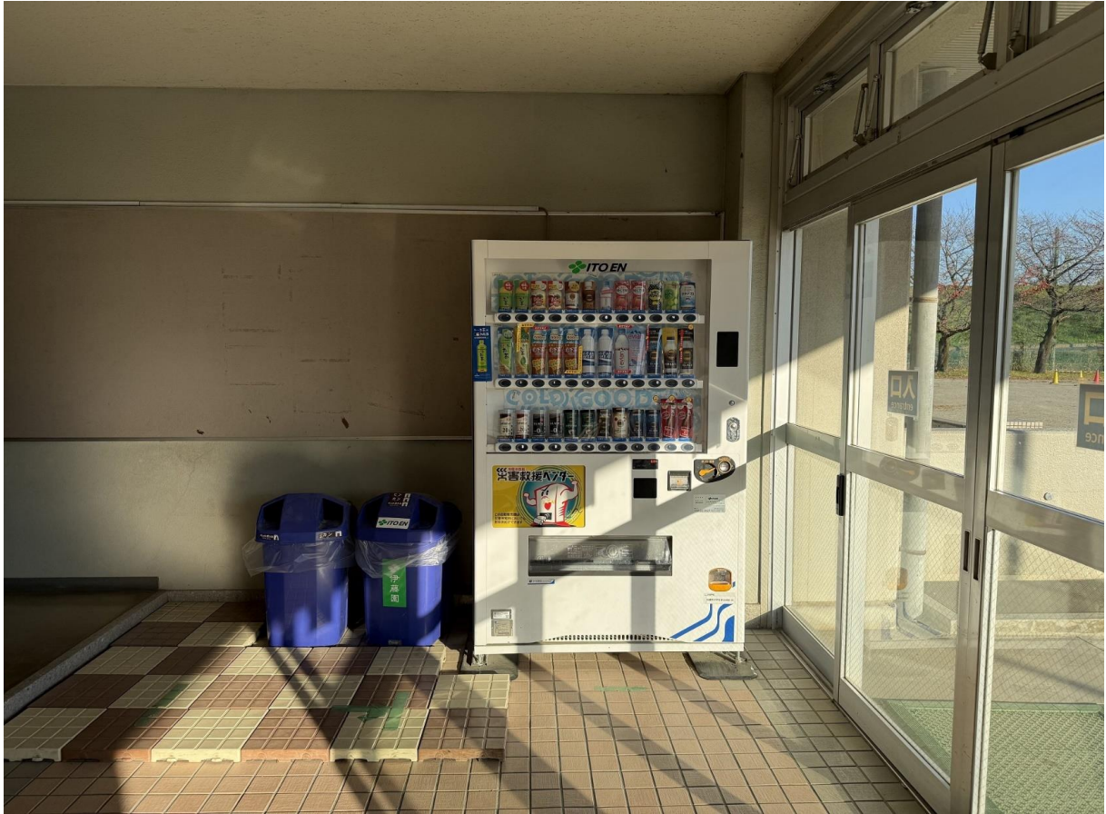
自動販売機は1台のみ設置