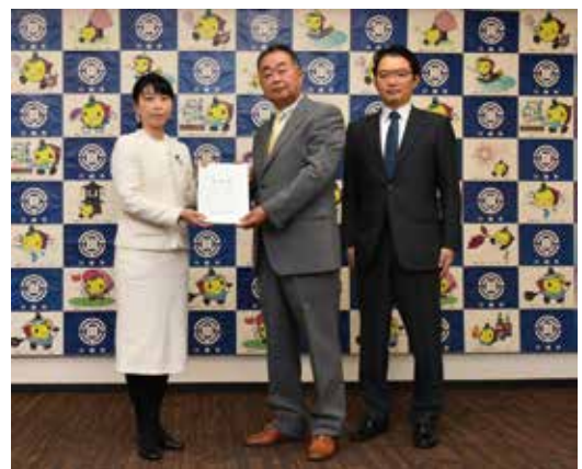
総合計画審議会答申の様子