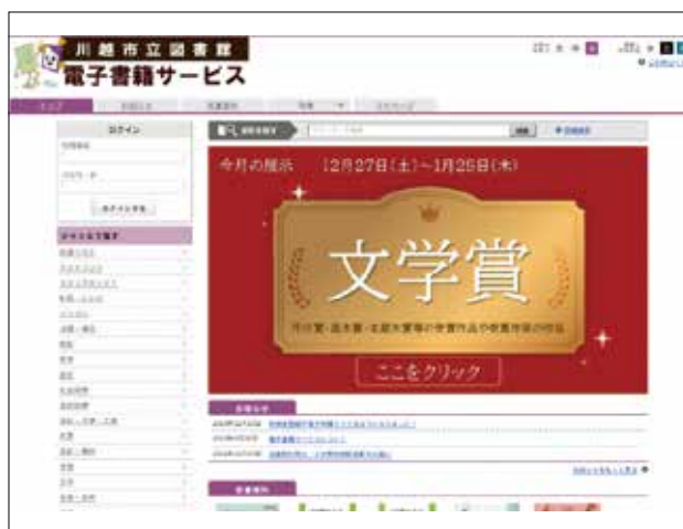
図書館の電子書籍サービスホームページ