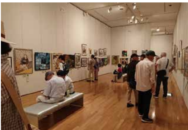
川越市美術展覧会の様子