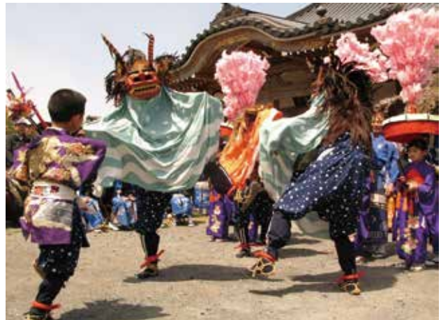
石原のささら獅子舞の様子