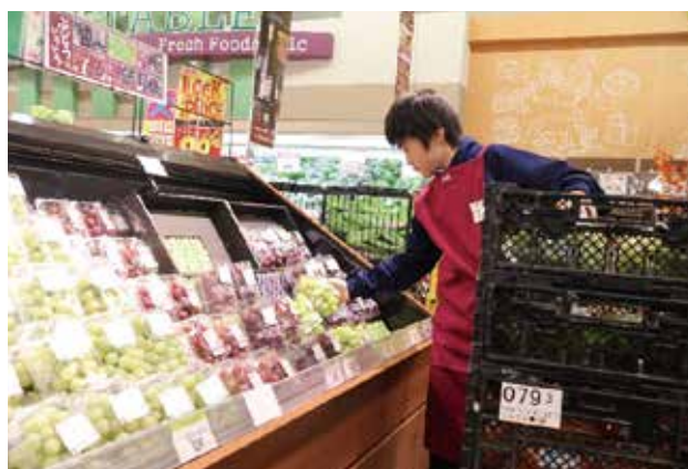
職場体験学習の様子