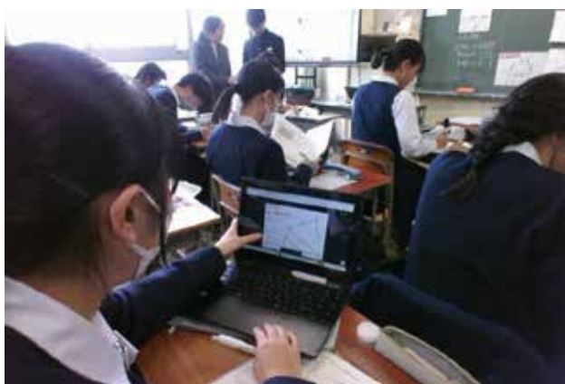
ICT を活用した授業風景