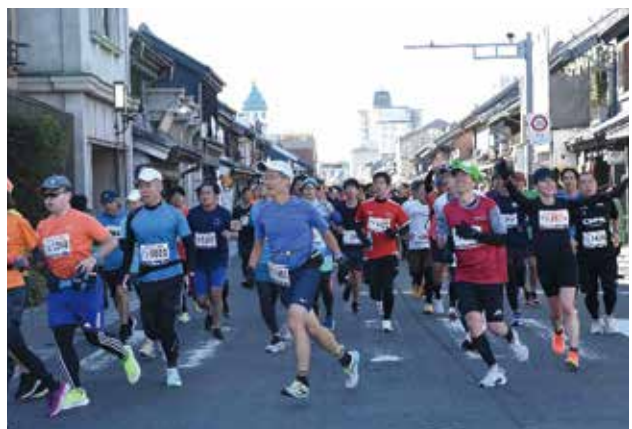
小江戸川越ハーフマラソンの様子