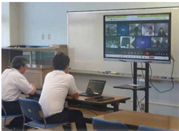
教職員のオンライン研修の様子