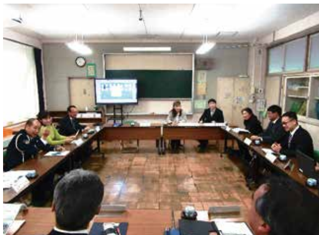
学校と地域住民との話し合いの様子