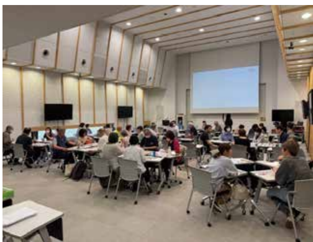
川越大学間連携講座（東洋大学）の様子