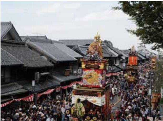
川越氷川祭の山車行事（川越まつり）の様子