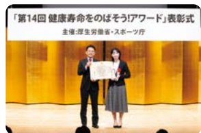
「第14回 健康寿命をのばそう!アワード」表彰式 主催:厚生労働省・スポーツ庁

川越市地域包括支援センター中央ひがしの介護予防の取り組みが、「第14回健康寿命をのばそう!アワード(介護予防・高齢者生活支援分野)」の厚生労働大臣最優秀賞となり、11月26日に表彰式が行われました。地域住民からの「コロナ禍であってもつながりが大切」といった声に応え、関係機関や地域住民、協力店舗等と協働のもと、地域に特化したお散歩地図「ここえどマップ」とポイントカード「ここえどカード」を作成し、地域全体のつながりを強化した点が評価されました。