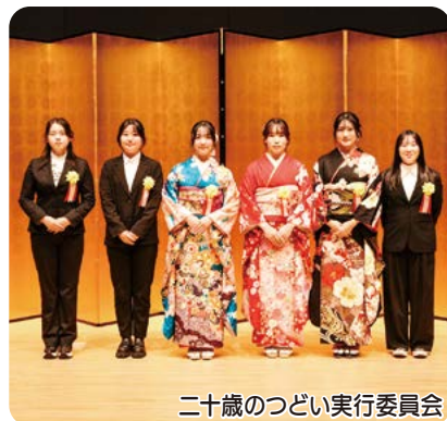
二十歳のつどい実行委員会