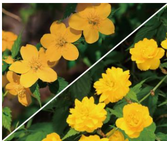
■市の花 山吹 (昭和 57 年制定)