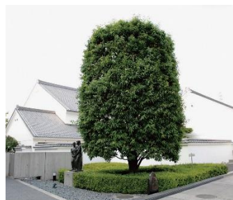
■市の木 かし (昭和 57 年制定)