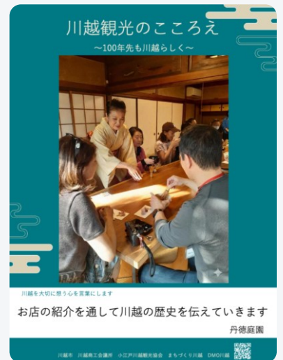
デジタルポスターのイメージ