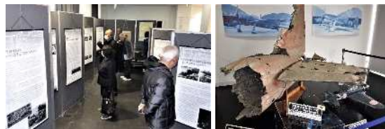
左：各種史料が掲載されたパネル展示で状況を詳しく解説 右：ソロモン諸島で回収された零式艦上戦闘機21型機体の一部

干しいも工場を見学しました。さつまいもの貯蔵や加工施設をはじめ、栽培に欠かせない各種の大型農機具など、代表者から丁寧な説明があり、福原地区では見られない干し芋づくりの現状について理解を深めることができました。