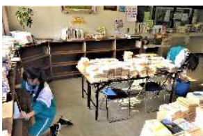
▲書棚の図書を全て取り出して入念に雑巾がけをする生徒