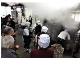
蒸かしたさつまいもを取り出す作業を見学する参加者

干しいも工場を見学しました。さつまいもの貯蔵や加工施設をはじめ、栽培に欠かせない各種の大型農機具など、代表者から丁寧な説明があり、福原地区では見られない干し芋づくりの現状について理解を深めることができました。