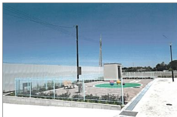
【完成した公園の一部】