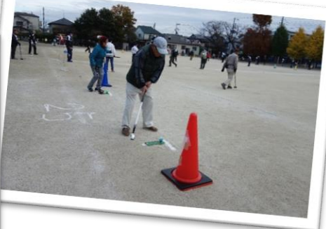
皆さん、お疲れさまでした！！