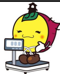
川越市マスコットキャラクター 埼玉県けんこう大使ときも