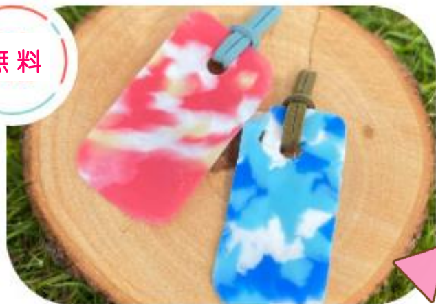
ペットボトルキャップで ブックマークづくり