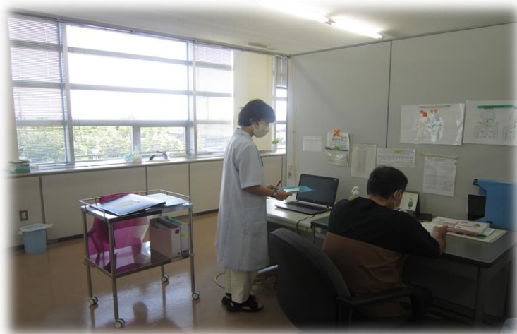
【がん検診時の診察補助の様子】