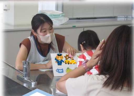
【乳幼児健診の様子】