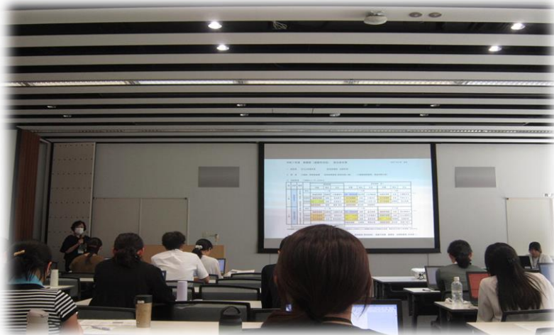
【保健師現任教育集合研修の様子】

保健師現任教育では新人から 3年目の保健師を中心に集合研 修や外部研修、個別研修など保 健師人材育成のための企画を 考えています。