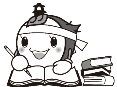
川越市マスコットキャラクターときも

川越市市民講座は、市民と川越市との協働で開催する、市民による市民のための講座です。 市民（講座主宰者）が企画・運営し、市は会場の手配と受講者の募集等を行っています。