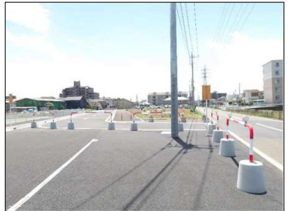
写真：供用開始区間（北側から見た様子）

令和8年5月29日に南古谷伊佐沼線の一部区間について供用開始しました。供用開始した範囲については、左の案内図のブルー塗りつぶしの範囲です。(市道4086号線より南側については、車両の通り抜けはできませんのでご了承ください。)