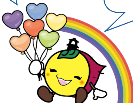
川越市マスコットキャラクターときも