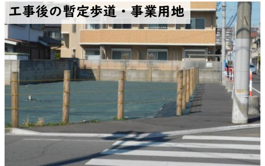
工事後の暫定歩道・事業用地

道路用地などの事業用地の取得や、令和7年度までに取得した事業用地における暫定歩道整備及び防草シートの設置などを行いました。そのほか、計画している道路の工事を実施するために必要となる道路詳細設計や、土地区画整理事業で必要となる換地設計、関係権利者との協議などを行いました。