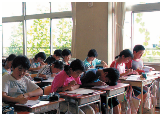
「涼しくなったよ」。快適な環境で勉強に励む、川越小学校6年生の皆さん