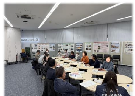
会議室での活動の様子