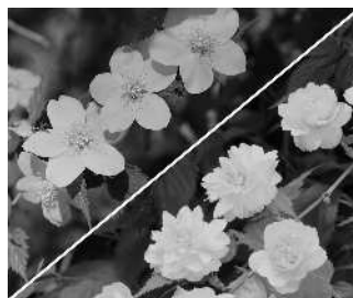
■市の花 山吹 (昭和57年制定)