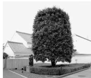
■市の木 かし (昭和57年制定)