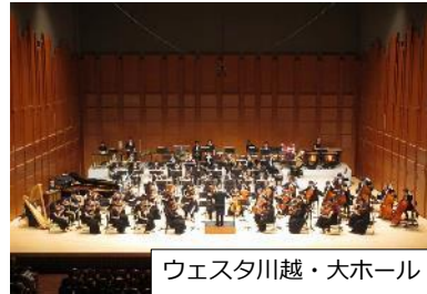
ウェスタ川越・大ホール

文化芸術振興拠点である「ウェスタ川越」や観光ルート上にある「美術館」での事業、小江戸川越ハーフマラソンなど、川越の文化・スポーツの魅力あふれる体験型・参加型事業を、市外の方々に発信し、 文化・スポーツをきっかけとした川越への訪問機会を創出 します。