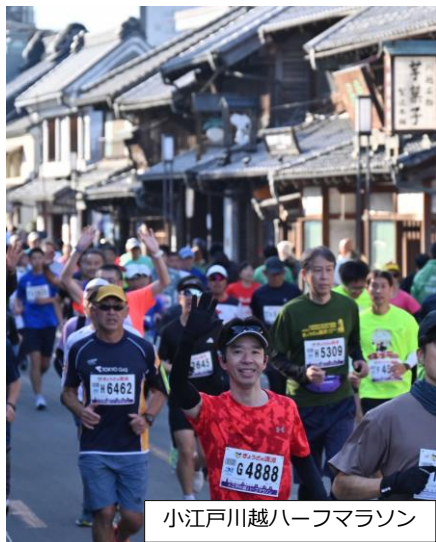
小江戸川越ハーフマラソン