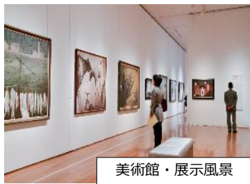
美術館・展示風景