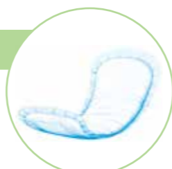
(イラストはサルバRパッド男女共用)