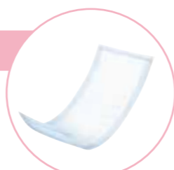
(写真は一般的なフラットタイプ)