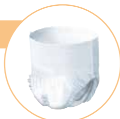
(イラストはサルバやわ楽パンツうす型)