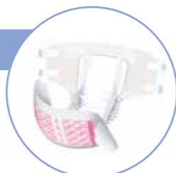
(イラストはサルバ安心Wフィット)