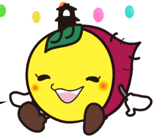
川越市マスコットキャラクター ときも

白すりゴマがご自宅にない時は、入れなくてもおいしく食べられます！ 噛みごたえのあるものを食べて、噛む力を育てましょう！