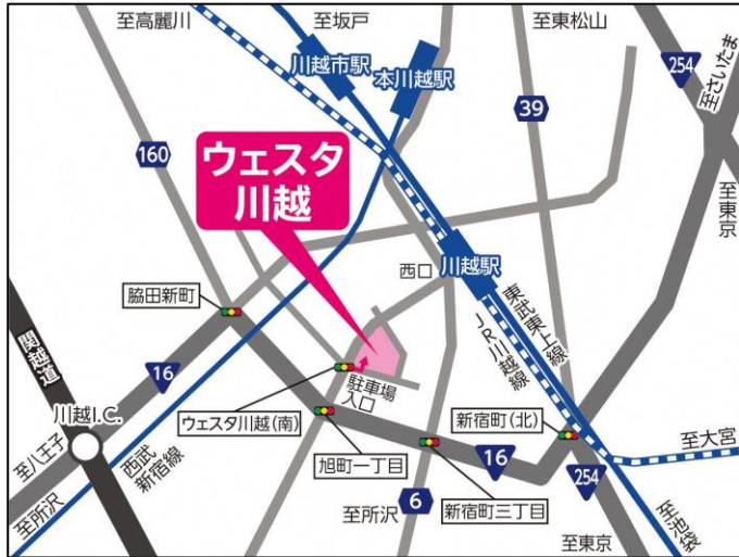
(ウエスタ川越周辺案内図)