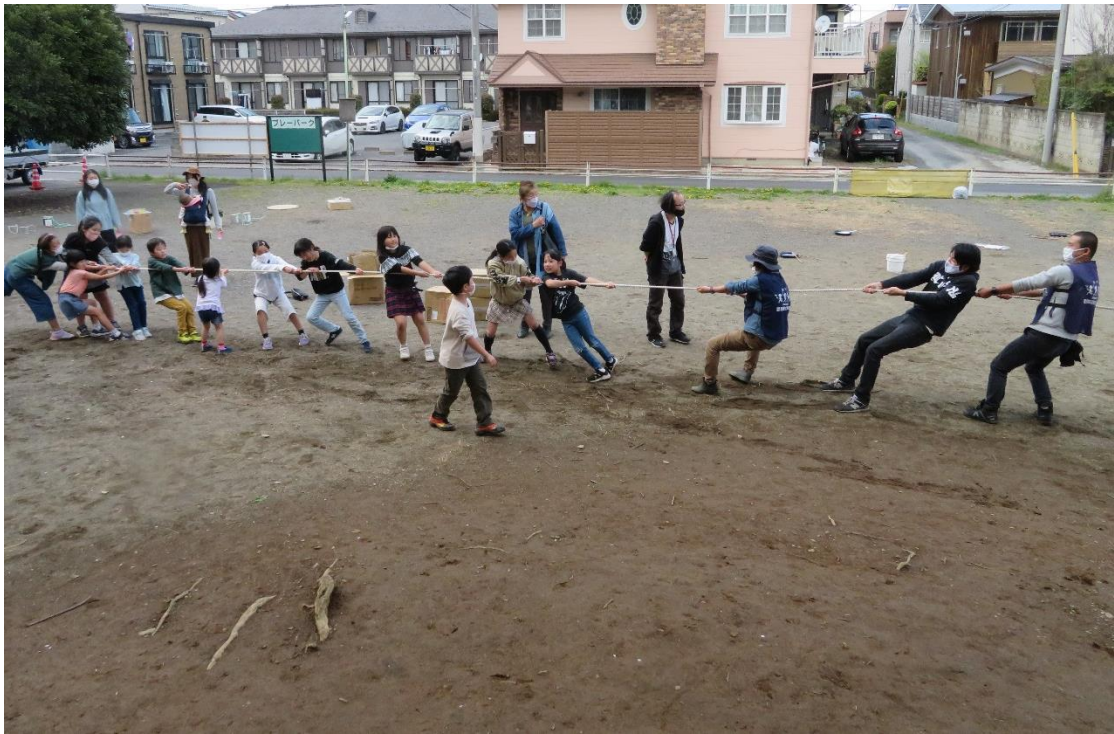
『みんなで楽しく綱引き』 ～こどもの城 プレーパーク～