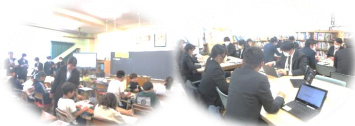
初任者研修代表授業 小学校 算数