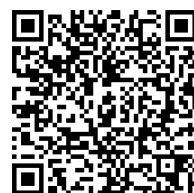
令和7年度版 川越市小・中学生学力向上プラン (家庭学習版)