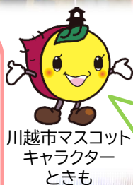
川越市マスコット キャラクター ときも

《参加者の振り返り(小6)》 英語指導助手と会話しながら、アクティビティができたことが楽しかったです。いろいろな友達と交流できたし、英語指導助手といっぱい話せたのでよかったと思います。