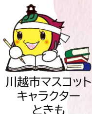
川越市マスコット キャラクター ときも