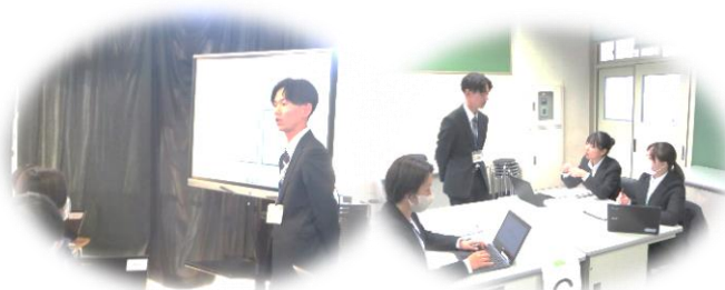
初任者研修代表授業 中学校 道徳