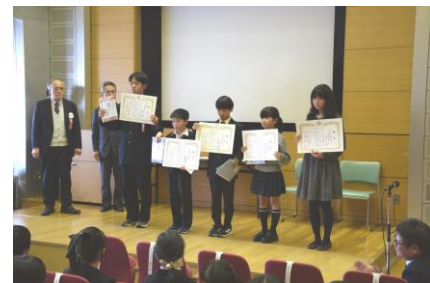
受賞者全員の表彰