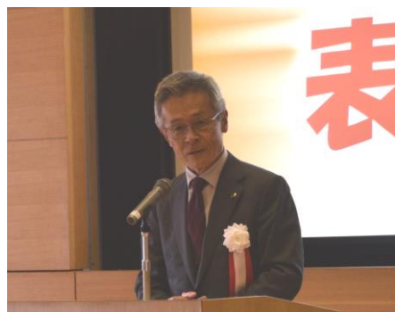
新保教育長あいさつ

終了後、川越市立美術館2階アートホールに移動し、新保教育長、遠藤本部長と一緒に集合写真を撮影しました。