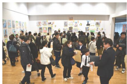
受賞作品の展示の前で