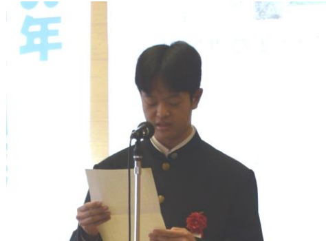
教育長賞受賞者の発表