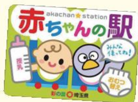
▲埼玉県のステッカー

誰でも自由におむつ替えや授乳が行えるスペースの愛称です。埼玉県では、「赤ちゃんの駅」の登録施設を募集し、乳幼児を持つ子育て家族が安心して外出できる環境づくりを進めています。