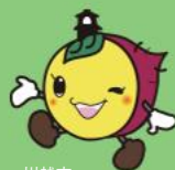
川越市 マスコットキャラクター ときも

本計画の対象となる子育て当事者の皆様に、ぜひ一度、本計画をご覧くださいいただけますと幸いです。