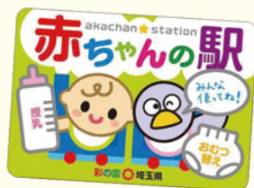
▲埼玉県のステッカー

誰でも自由におむつ替えや授乳が行えるスペースの愛称です。埼玉県では、「赤ちゃんの駅」の登録施設を募集し、乳幼児を持つ子育て家族が安心して外出できる環境づくりを進めています。