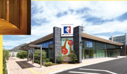
愛愛こどもクリニック (2022年8月開院)