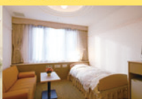
入院室(6タイプ) ※全60室個室