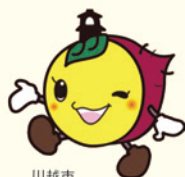
川越市 マスコットキャラクター ときも