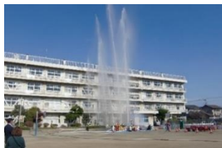
山田分団と自警消防隊による一斉放水