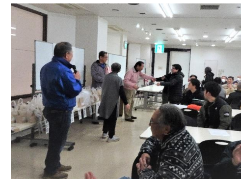
新狭山グランドボウル