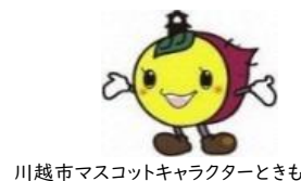
川越市マスコットキャラクターときも

霞ヶ関公民館 〒350-1175 川越市大字笠幡177番地1 電話番号:049-231-1009 ファクス番号:049-239-1086